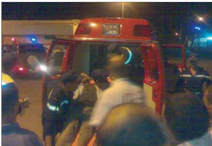
Mobilisation pour sauver les blessés

La route continue de tuer chez nous. Quinze morts, dont sept militaires, et 42 blessés est le bilan horrible d'un dramatique accident de la circulation qui s'est produit dans la nuit de dimanche 16 à lundi 17 septembre, sur la route d'Ait Athmane, à 30 kilomètres de la ville d'Errachidia.