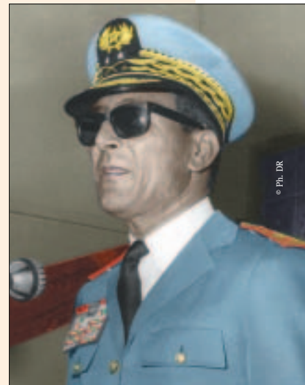
Le général Mohamed Oufkir.

Dont la rencontre du 25 septembre 1969 à Rabat, au lendemain de l'incendie criminel de la Mosquée Al-Aqsa d'Al Qods, par un terroriste juif, le 21 août 1969. Réunion qui aboutira à la naissance, en mars 1970, de l'Organisation de la Conférence islamique. Et c'est dans la capitale marocaine également, le 26 octobre 1974, lors du huitième sommet arabe, que l'Organisation de Libération de la Palestine (OLP) sera reconnue par les États membres de la Ligue arabe comme « seul et légitime représentant du peuple palestinien ». Quoi qu'il en soit, une chose est sûre: les services secrets marocains et israéliens ont toujours eu à coopérer depuis des décennies. Encore plus, à l'heure des menaces planétaires communes et grandissantes représentées par le terrorisme et l'intégrisme islamiste, ils ont mené ensemble des opérations ponctuelles sous l'égide de la CIA, notamment après le choc du 11 septembre 2001. Le monde du renseignement a, par nature, des raisons où la sensibilité n'a pas de raison d'être. □