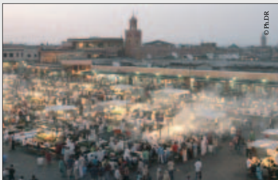
La place Jemaa El Fna .

Les conteurs auront leur heure de gloire. L'Unesco organise, le 21 mars 2007 à Jamaâ El Fna, à Marrakech, un moussem en leur honneur dans le cadre du projet Préservation, Revitalisation et Promotion de la Place Jamaâ El Fna. Cette place historique, proclamée patrimoine oral et