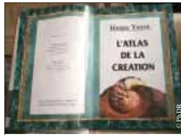
Couverture du livre de Harun Yahya.

Un vent de panique souffle sur les écoles françaises. Un livre réfutant au nom du Coran le darwinisme et la théorie de l'évolution, L'Atlas de la création , a été massivement envoyé