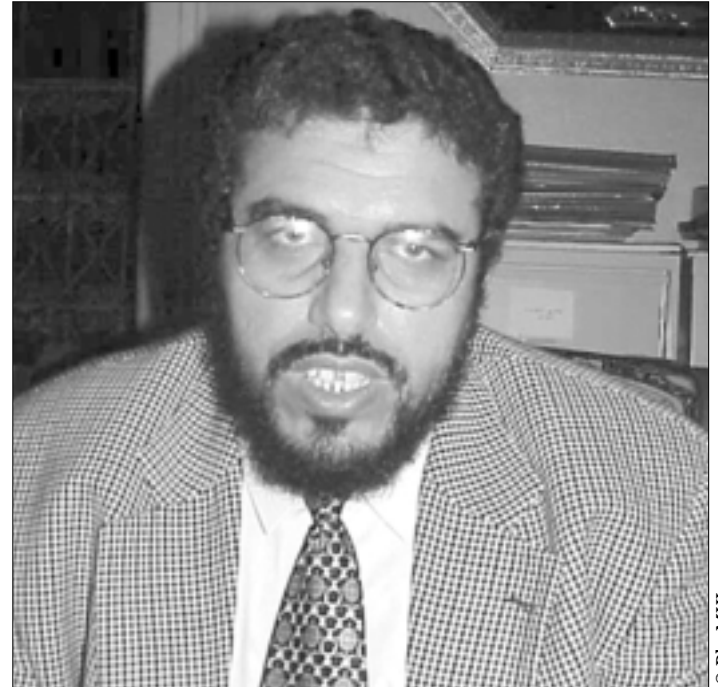
• Mutapha Ramid.

Le choix de Driss Jettou, hors-partis politiques, au terme des législatives de 2002, a ravivé la polémique à propos des critères de sa désignation, de sa latitude d'initiative et de décision. Et, finalement, de son statut dans le texte de la Constitution. Là aussi les adeptes du constitutionnalisme comparé en sont pour leurs frais. Concernant la nomination du Premier ministre, nous sommes logés à la même enseigne que l'Espagne monarchique et la France républicaine. Dans l'article 62 et l'article 8 de la Constitution de chacun des deux pays, le chef du gouvernement est nommé par le Roi pour l'un et le Président pour l'autre. La jeune démocratie espagnole applique à la lettre le formalisme démocratique. Mais il est arrivé qu'en France, sa sœur aînée, le maître de l'Elysée choisisse le locataire de Matignon en dehors de la sphère partisane. Ce fut le cas de Pierre Messmer sous de