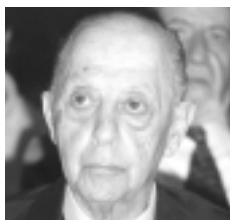
• Abdelhadi Boutaleb

Le Centre des Etudes et des Initiatives inaugure les activités de sa nouvelle saison avec une conférence donnée par le Professeur Abdelhadi Boutaleb, membre de l'Académie du Royaume, sur le thème: "Le conflit américain-irakien et les transformations stratégiques au Moyen-Orient". Cette conférence sera donnée le mercredi 29 janvier 2003 au club de la presse à Rabat-Hassan à partir de 19h.