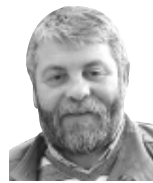
Par Amale Samie

Ya des peuples visionnaires et des peuples aveugles qui se cognent contre les murs. Les peuples visionnaires le sont par décret américain. Parce que les Américains sont des visionnaires. Ils mettent leur main en visière sur leur front et ils déchiffrent les nuages de fumée émis par Taureau Assis à l'ombre des cactus candélabres. Les Américains ont transformé le Cosmos en flipper où les fusées intercontinentales font figure de pétards de Achoura. Ils ont déjà neutralisé toute force d'opposition sur Terre, alors ils vont bombarder Mars pour qu'il y ait des radiations nucléaires pendant 15 000 ans. Ils ont même piégé leur portion d'Antarctique déjà ceinte de barbelés.