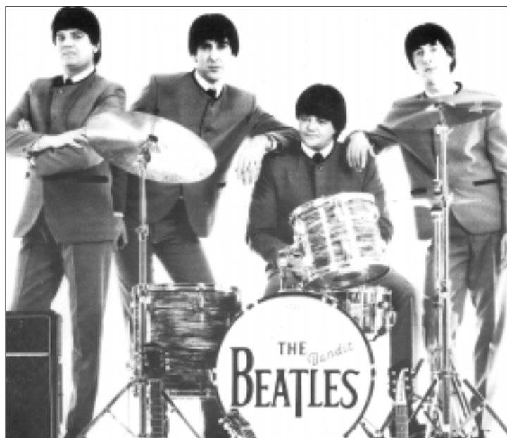
• Les Bandit Beatles.

Ces quatre jeunes Anglais sont une authentique et parfaite reproduction des Beatles. Ils reprennent les meilleurs titres de leur répertoire avec, entre autres, des chansons comme "Can't buy me love", "Yesterday", "Help", "Let it be", "Hey Jude", "Hard days night". Les Bandit Beatles sont considérés comme le meilleur "beatle group" par les spécialistes du show-business et ce, au Royaume-Uni et dans