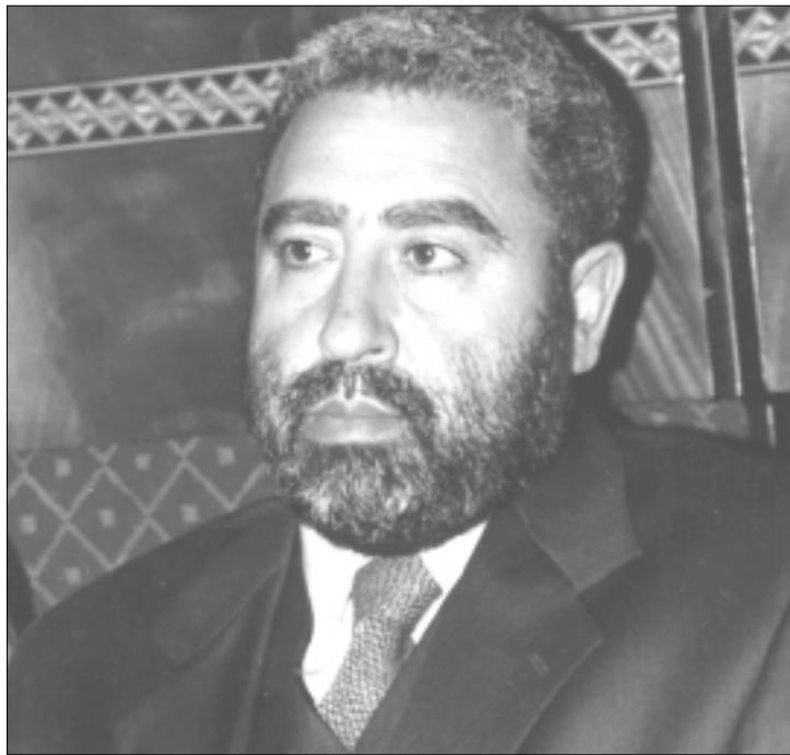
• Mohamed Achâari, ministre des Affaires culturelles.

Mohamed Achâari a souligné le coût exorbitant des opérations de sauvegarde, indiquant que le mètre carré coûte 3000 dirhams et qu'un bâtiment moyen nécessiterait pas moins de cinq millions